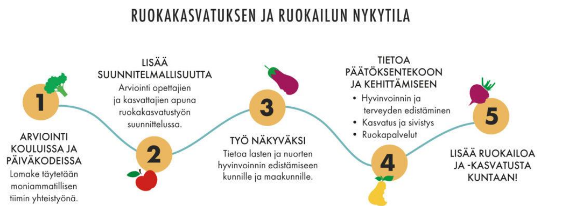
Kuva 1. Ruokakasvatuksen ja ruokailun nykytila, www.nykytila.fi .

Päiväkotien ja koulujen yksikkökohtaista ruokakasvatusta on kehitetty moniammatillista nykytila.fi -arviointia hyödyntäen. Nykytila.fi-työkalun avulla saadaan arvio päiväkodin tai koulun ruokailun ja ruokakasvatuksen nykytilasta, ja sen avulla löydetään konkreettisia kehittämissuhteita yksikön toimintaan (kuva 1).