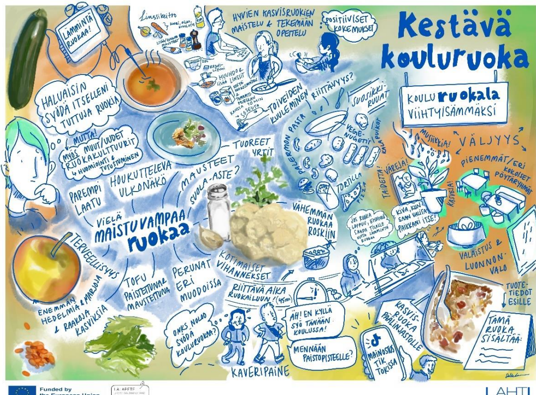
Kuva 4. Lahden Mukkulan koulun Kestävä kouluruoka -pilotin kooste.