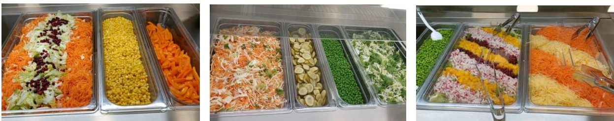
Kuva 6. Kärkölen Yhtenäiskoulun Kouluravintola Apilan jakamia some-kuvia salaattitarjoiluistaan.

Myönteinen ravitsemuspuhe on tärkeää kaikissa ravitsemukseen liittyvissä kohtaamisissa, kuten kasvatuksessa ja opetuksessa, yhteisen ruuanlaiton tai syömisen äärellä tapahtuvassa keskustelussa, elintapaohjauksessa ja muussa viestinnässä. Miltei kaikissa alueemme kunnissa ravitsemukseen liittyvää viestintää toteutettiin vuonna 2022 vaihtelevin tavoin, esim. erilaisten tilaisuuksien, tapahtumien ja netti- tai sosiaalisen median viestinnän avulla. Esimerkiksi Kärkölen Yhtenäiskoulun Kouluravintola Apila jakoi facebookissa kuvia kouluaterioista herkullisine salaattitarjoiluineen (kuva 6).