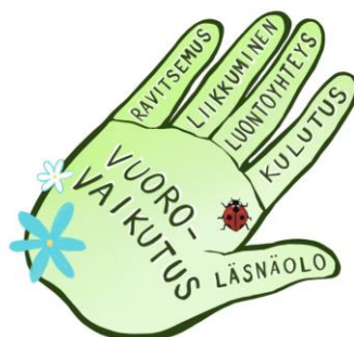
Kestävän neuvolatyön muistisormet

Kaikissa alueemme kunnissa toteutetaan liikuntaneuvontaa , johon ravitsemus kuuluu vahvasti mukaan. Terveyttä edistävät ruokavalinnat ja ateriarvotmin säännöllisyys ovat keskeisiä keskusteluaiheita tapaamisilla. Vuoden 2022 aikana liikuntaneuvonnan asiakkaita oli noin 600, ja yksittäisiä asiakaskäyntejä oli miltei 2000.