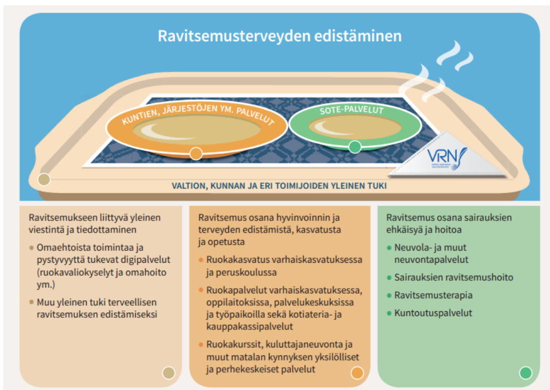
Kuva 7. Ravitsemusterveyden edistäminen, Ravitsemuksella hyvinvointia, Ruokavirasto.

Sosiaali- ja terveyspalveluiden järjestämisvastuun siirryttyä kunnilta hyvinvointialuille säilyy päävastuu hyvinvoinnin ja terveyden edistämisestä edelleen kunnilla. Ravitsemusterveyden edistämisen tärkeitä toimijoita ovat sosiaali- ja terveydenhuollon lisäksi mm. kunnan sivistystoimi (varhaiskasvatus ja perusopetus), kunnalliset ja yksityiset ruokapalvelun tuottajat, järjestötoimijat ja paikalliset yhteisöt.