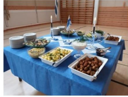
Kuva 3. Ruokakasvatus osana koulutyötä Asikkalan Vesivehmaan koulussa.

Hartolan Yhtenäiskoulussa tehtiin lukuvuoden 2021-22 aikana seuraavia toimia ruokakasvatuksen edistämiseksi: nykytila.fi-arviointi, ruokakasvatuskalenteri koulun näyttötaululle, ruokaraati, kysely kouluruuasta, ruokakasvatus pedagogisessa kahvilassa, ruokakasvatuksen oppitunnit, Ruokatutka-lähettiläs 5. luokan kotitalouden valinnaiskursilla, maistelu-toimintapiste kodin ja koulun päivässä, viestintä huoltajille, oppilasryhmien vierailut ruokapalveluun ja koulun ruokalan viihtyisyyteen panostaminen esim. juhlakoristelulla ja oppilaiden kuvataidetoilla.