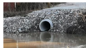
f) Hulevesien purkaminen vesistöön