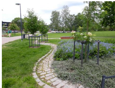
b) Ohjaus kasvillisuusalueille kasvien käyttöön