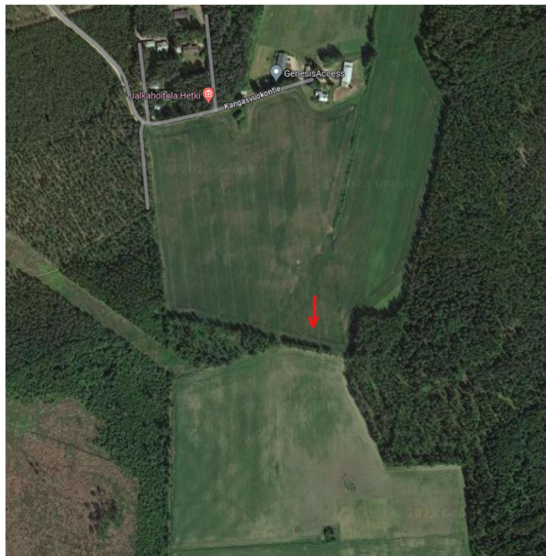
Kuva 1. Lähteenmäen peltojen rajautuminen puustoon pohjoisessa.

Lausunnon pohdittiin Honkamäen ja Niprolan alueiden eroja maisemoinnin suhteen. Kuten lausunnonssakin on huomioitu, Honkamäki sijaitsee korkeammalla. Sieltä rakennuksesta katsottuna koko avoin maisema aukeaa aurinkovoimalan suuntaan. Tästä syystä maisemointia on suunniteltu Honkamäeltä katsottuna laajasti aukeavan maiseman suuntaan. Niprola taas sijaitsee samalla tasolla suunniteltujen paneelien kanssa ja maisema rajoittuu etelään katsottaessa metsäkaistaleeseen kuten kuvasta 1 näkyy. Näin ollen Niprolasta ei ole enenkään näkynyt Lähteenmäen pelloille, joten Niprolan asukkaiden maisema ei tule muuttumaan eikä näin tarvitse lisämaisemointia. Lähteenmäen pellon vieressä asuu pellon maanomistaja, ja hän ei halunnut tässä vaiheessa päättää maisemoinnista eikä sitä kaivannut. Sovittiin vain etäisyydestä kiinteistöön hänen kanssaan. Näistä syistä siis saattoi syntyä vaikutelma, että laajennusalueen suhteen olisi tehty vähäisempää maisemavaikutusten arviointia.