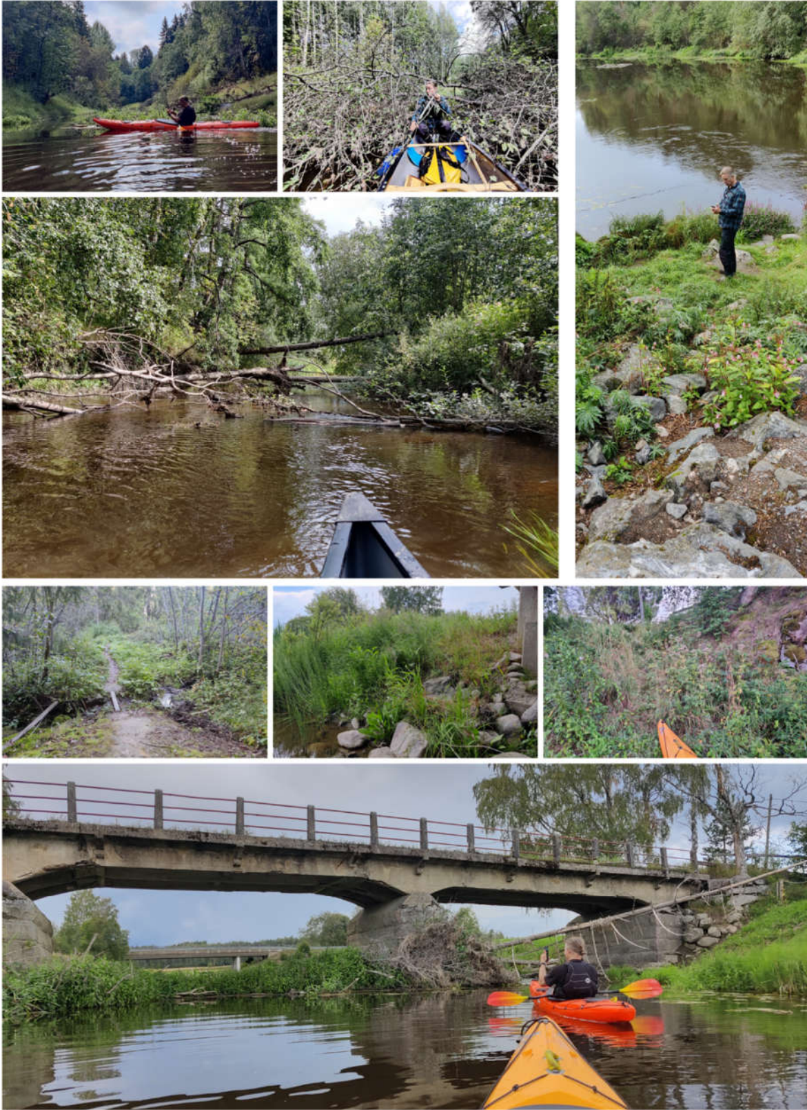
Kuva: Kohteet ovat reitiltä sekä keskeisiltä nousu- ja laskupaikoilta. Kuvat on otettu Orimattilassa kesällä 2023.