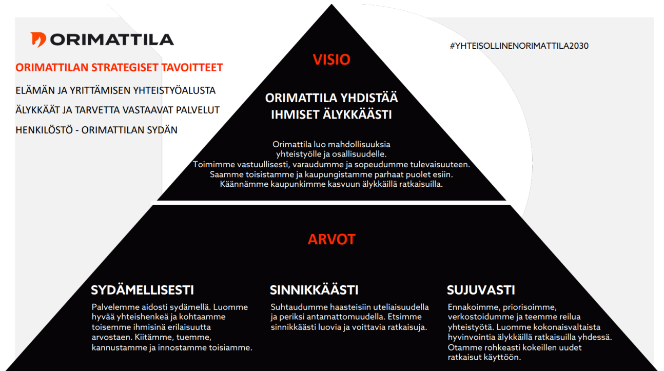
Kuva: Orimattilan kaupungin strategiset tavoitteet, visio ja arvot