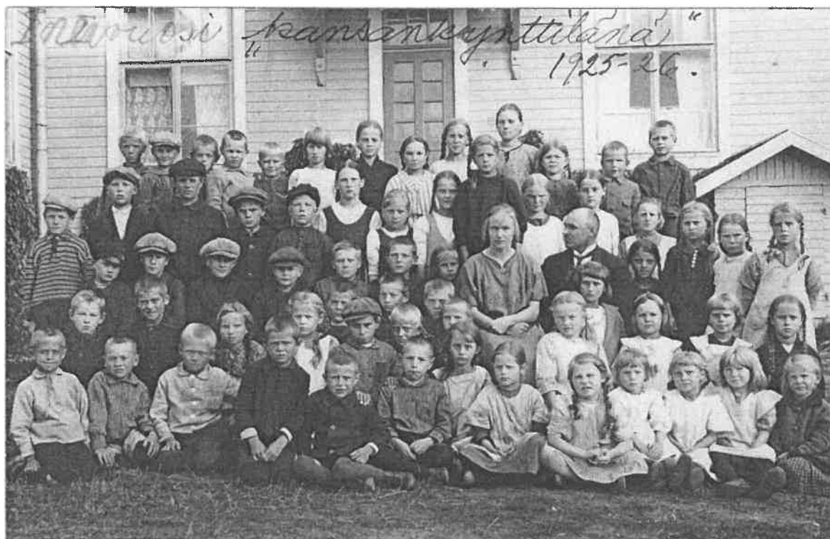
Virenojan koulun oppilaita vuodelta 1925

”Itselleni tulee kyllä näistä koulujen lakkauttamisista se olo, että kun nämä viimeisetkin palvelut viedään kylistä, niin samalla kuolee osa suomalaista kulttuuria. 😞 Kylät hiljenevät ja jäävät rapistumaan turhan panttina kun väki suuntaa kaupunkeihin.”