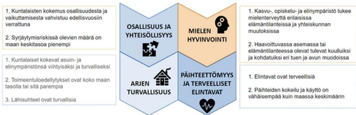
Kuva 6. Alueelliset hyte-kärjet Päijät-Hämeessä sekä niiden tavoitteet.

Orimattilan painopisteet juontuvat maakunnallisesti sovituista HYTE-kärjistä (2021–2025):