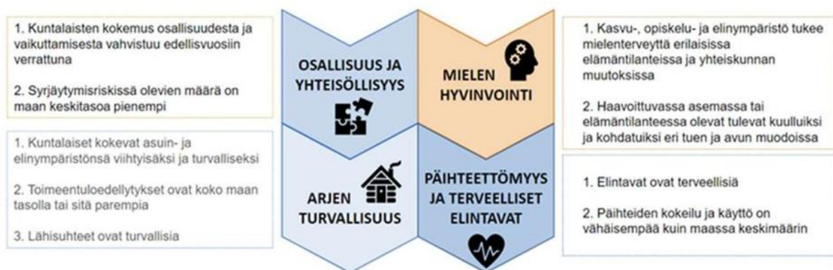
Kuva 4. Päijät-Hämeen hyte-kärjet

Orimattilan hyvinvoinnin ja terveyden edistämisen osa-alueet pohjautuvat Päijät-Hämeessä yhteisesti sovittuihin hyte-kärkiin, joita ovat mielen hyvinvointi, päihteettömyys ja terveelliset elintavat, osallisuus ja yhteisöllisyys sekä arjen turvallisuus.